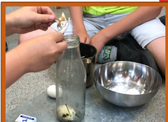
Das Ei in der Flasche

„Wie kommt das Ei in eine Flasche ohne kaputt zu gehen? Wir haben das Zeitungspapier angezündet und in eine Flasche gehalten. Danach haben wir das Ei auf die Flasche gelegt und dann ist das Ei in die Flasche gesaugt worden.“ –Journaleintrag von Mika