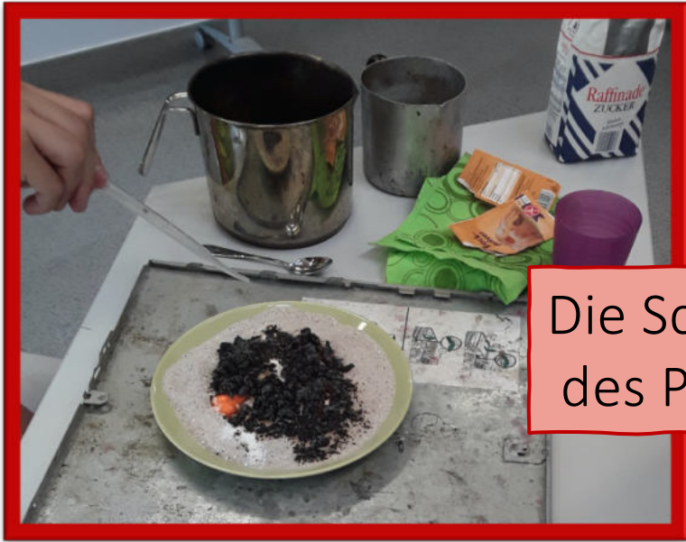
Die Schlange des Pharaos

(Mika, Oskar und Robert und weitere Forscher*innen)