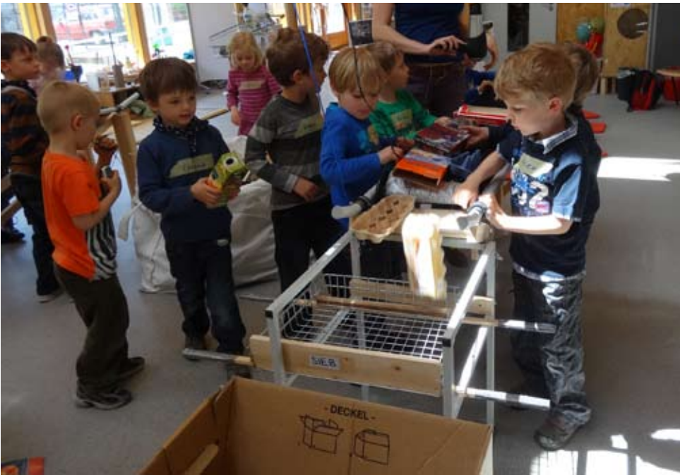
Zunächst muss der Müll sortiert werden. Die Kinder machen sich gemeinsam an die Arbeit.

Was gehört wohin? Was passt zusammen und was passt nicht zueinander? Diese Fragen treten nun in den Vordergrund.